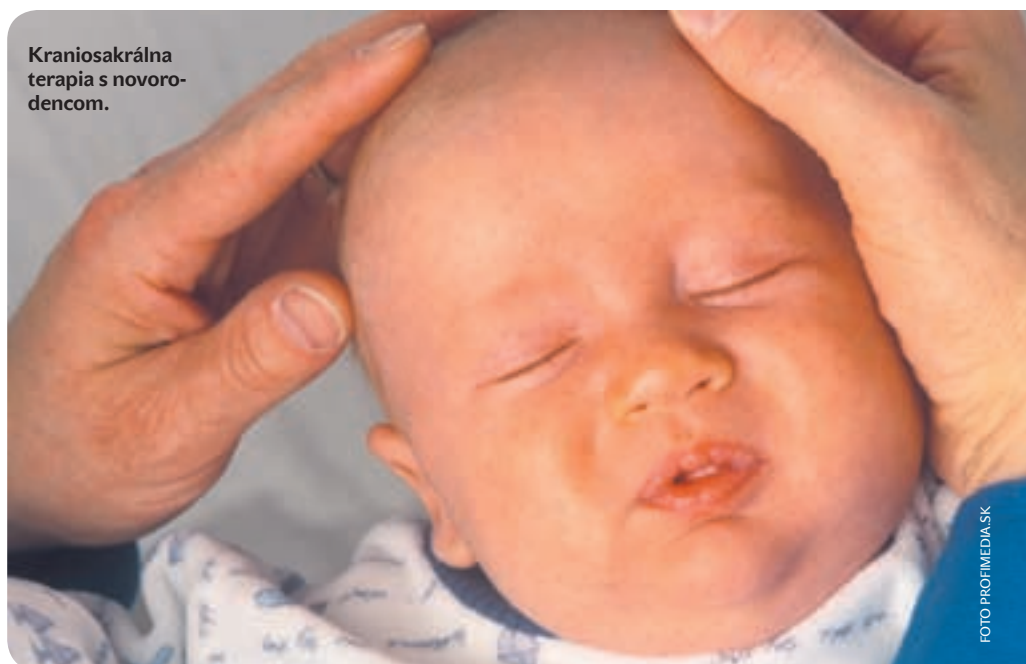
Kraniosakrálna terapia s novorodencom.

Pri deťoch je osteopatia takisto veľmi užitočná metóda. Osteopat môže pomôcť napríklad malým bábätkám, ktoré sú po ťažsom pôrode a majú mikrotraumy hlavičky spôsobené jem-