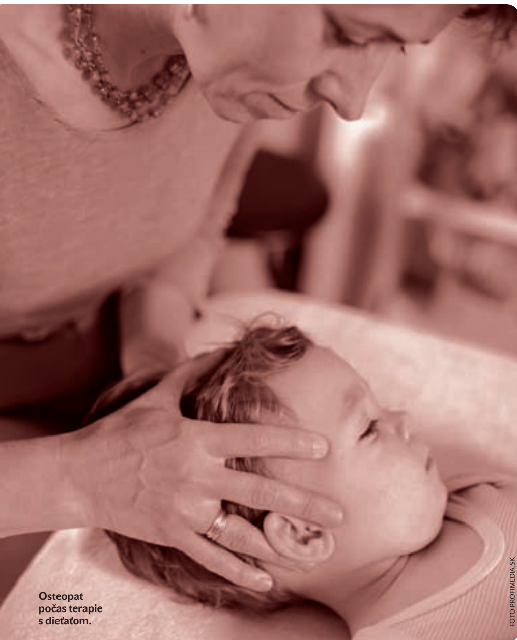
Osteopat počas terapie s dieťaťom.

Aj na to sú techniky. Napríklad na bránicu sú k dispozícii rôzne hmaty, aby osteopat zistil, či v niektorej jej časti nie je zvýšené napätie, stuhnutie. Vnútorne orgány sa dajú vyšetriť známymi spôsobmi, t. j. pohmatom, poklopom... Pri chronickej infekcii dýchacích ciest, napríklad pri zápale dutín, sa osteopat usiluje zlepšiť ich drenáž, po zápale pľúc môže byť horšia mobi-